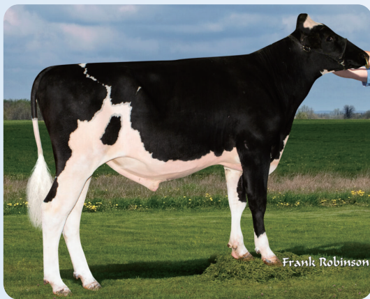
本牛：レディース マナー FRSTBT オペラ-ET