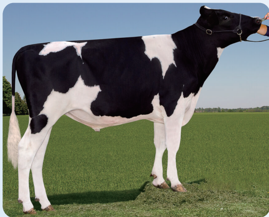
本牛：ウィンスター DLXゴースト ET